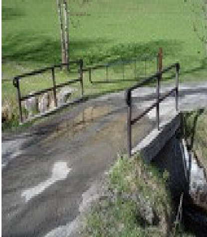
Pont du Bolou