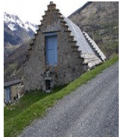
Grange typique de la vallée