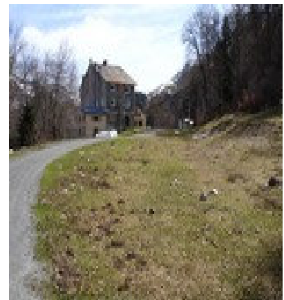
Refuge « La Solitude »