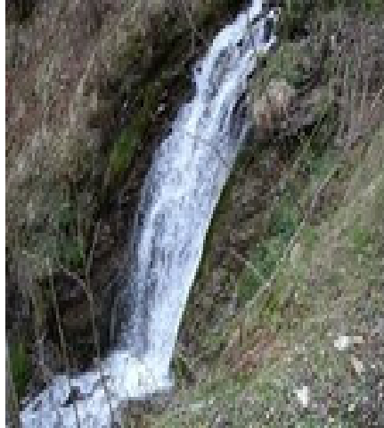
Cascade sur le Bolou