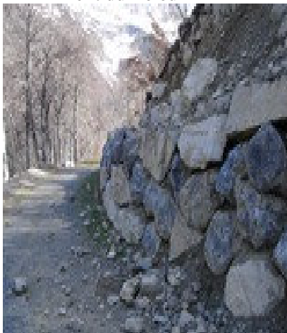
Empierrement de l'allée verte