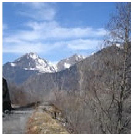
Vue sur le Soum de Nère