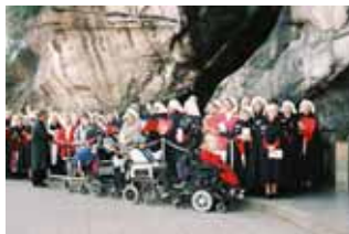
Une messe à la Grotte lors du pèlerinage 2004

Le 37 ème pèlerinage international de l'Ordre Souverain Militaire et Hospitalier de Saint-Jean de Jérusalem de Rhodes et de Malte – communément dénommé Ordre de Malte – se réunit à Lourdes du 29 avril au 3 mai 2005. Il rassemble environ 4 500 pèlerins dont 1 000 malades.