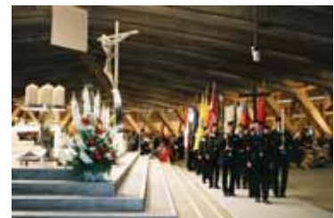
De nombreux pays sont représentés

Les différentes délégations présentes sont originaires d'Autriche, de Belgique, du Canada, des Etats-Unis, de France, de Hongrie, d'Espagne, d'Irlande, d'Italie, du Liban, du Luxembourg, de Malte, des Pays-Bas, de Pologne, du Royaume-Uni, de Suisse.