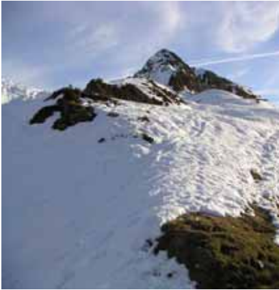
Le pic Naouit