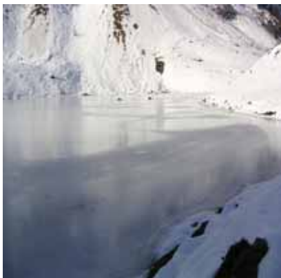
Lac d'Iaby gelé