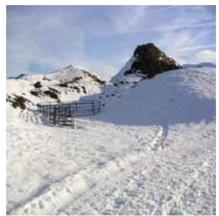
Pic de la Mulata