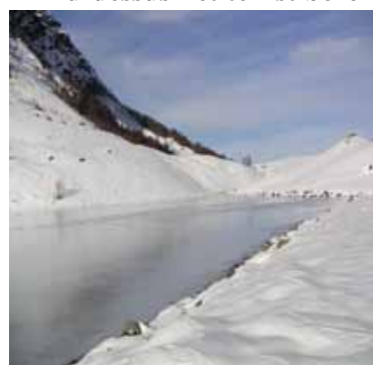
Neige et glace à Isaby