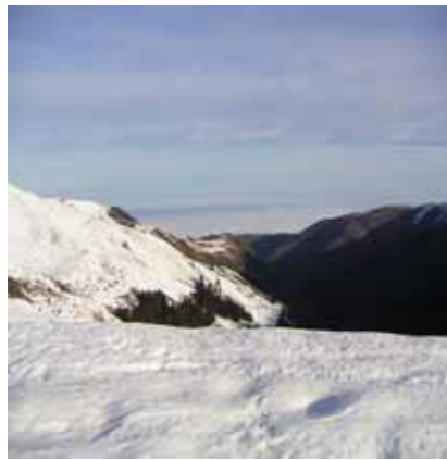
Mer de nuages en plaine