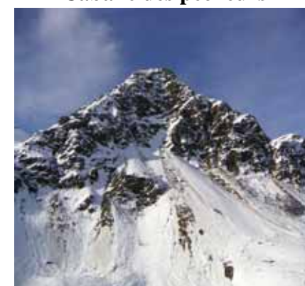
Soum de la Siarrouse