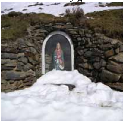
Oratoire sous le pic de Mulata