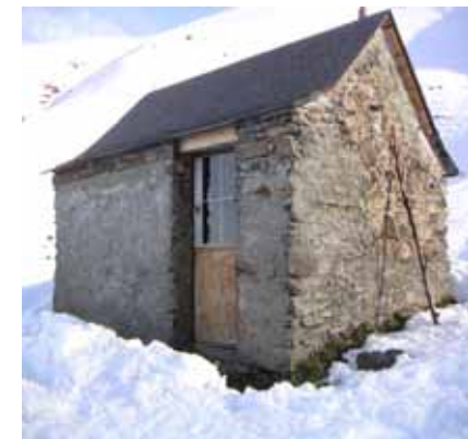
Cabane des pêcheurs