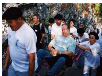
Le Chemin de Croix où valides et handicapés ne font qu'un, est un des moments forts du rassemblement.

liaison nous vous solliciterons pour des missions diverses dont l'objectif principal est de rassembler le plus grand nombre de participants régionaux qui, jusqu'ici font profondément défaut.