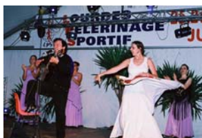
Soirée Curro Savoy lors du pèlerinage 2004

Qu'il fallait revoir les prix du séjour en élargissant la gamme des hébergements . Des bénévoles vont rencontrer l'institution Ste Marie pour voir la possibilité d'hébergement pour les nuitées du vendredi et du samedi : ils nous tiendront au courant du résultat de leur démarche.