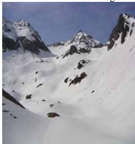
Arrivée à la Grande Estibère