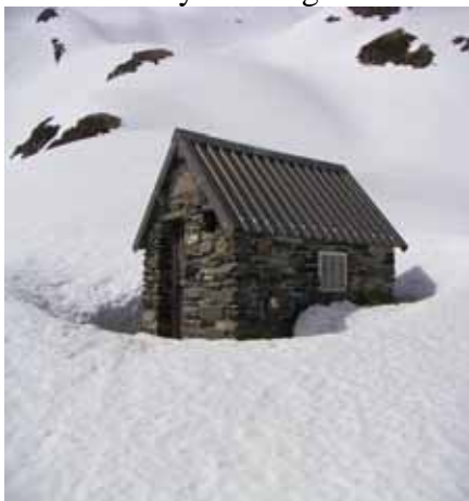
Cabane Grande Estibère