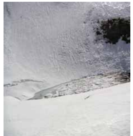
Dets Plagnous encore gelé