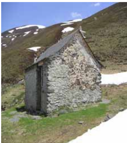
Cabane des pêcheurs