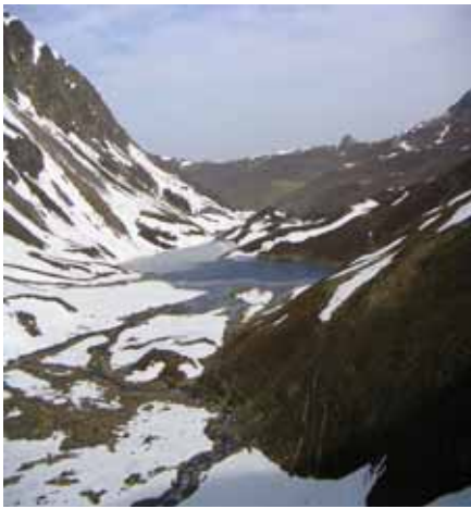
Lac Isaby moitié gelé