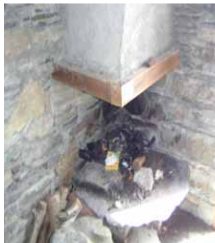
Atre de la cabane Estibère