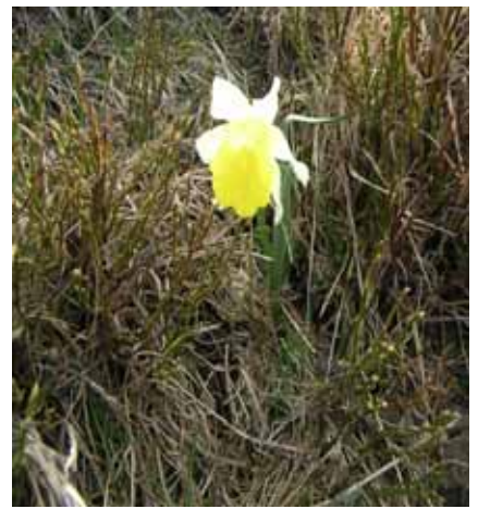
Cadeau 1er Mai