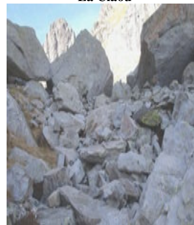
Arrivée près du lac