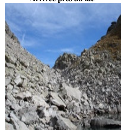
Col au-dessus du lac