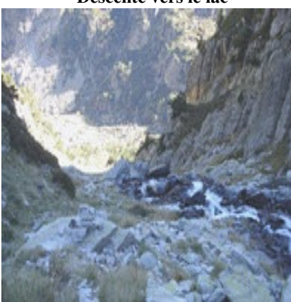
Descente vers la retenue d'eau