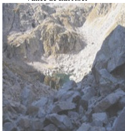
Descente vers le lac