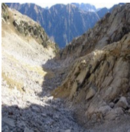
Dernier vallon avant le lac