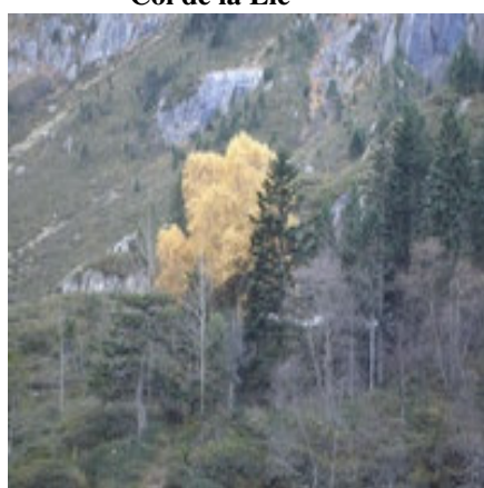
Bouquet d'or automnal