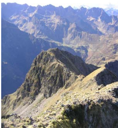
Descente du col des Rosques