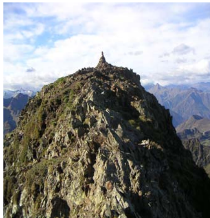
Cairn ouest sommital