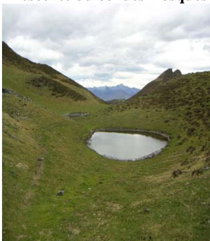
Laquet du clot du Serpent