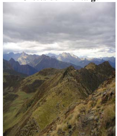
La chaîne sous le soleil automnal