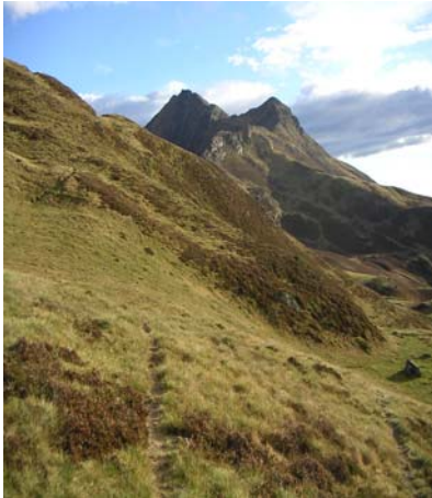
Montaigu du col de Barran