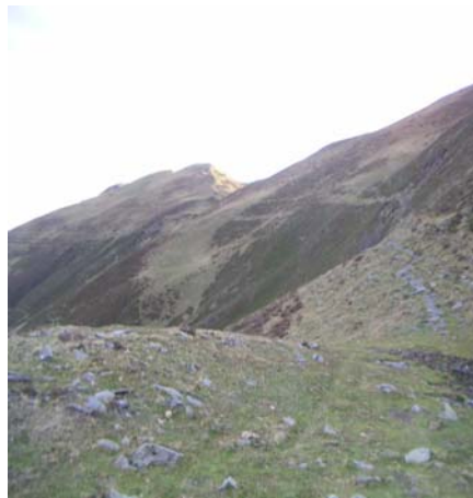
Col de Barran