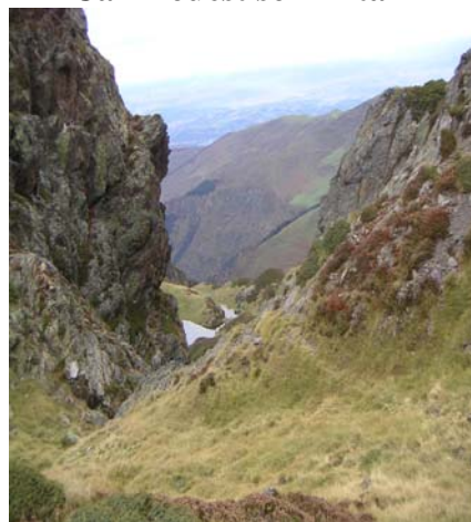
le col des Rosques