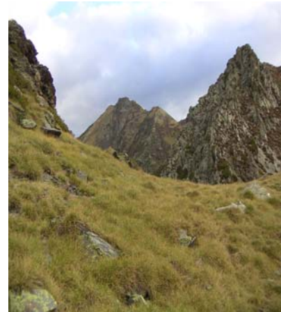
Crêtes du Montaigu