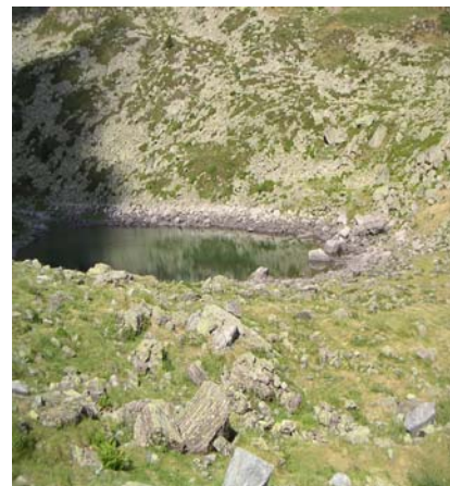
Le lac noir