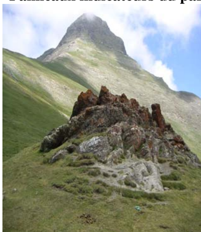
Le soum de Grum