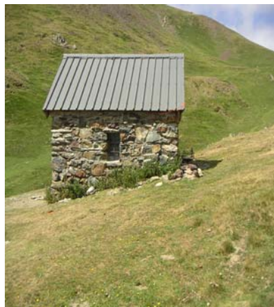
Première cabane d'Arras