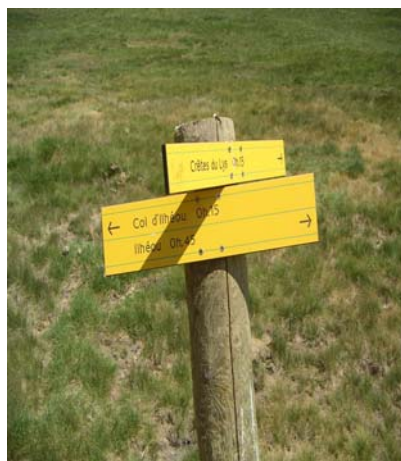
Panneaux indicateurs du parc