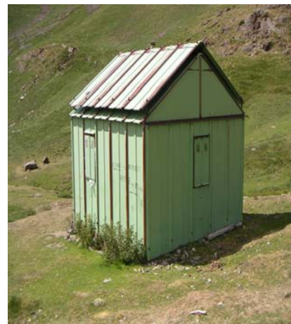
Seconde cabane d'Arras