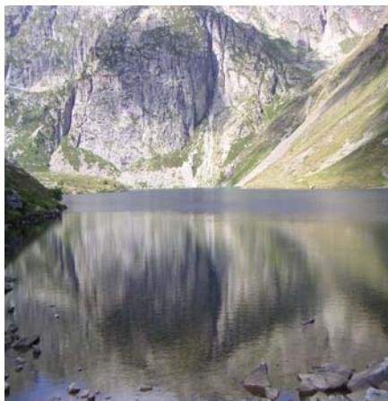
Le lac bleu d'Ilhéou