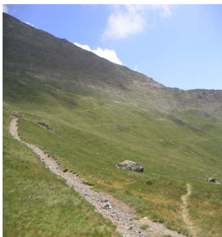
Arrivée au col d'Ilhéou