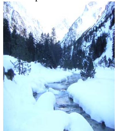
Le gave du Lutour