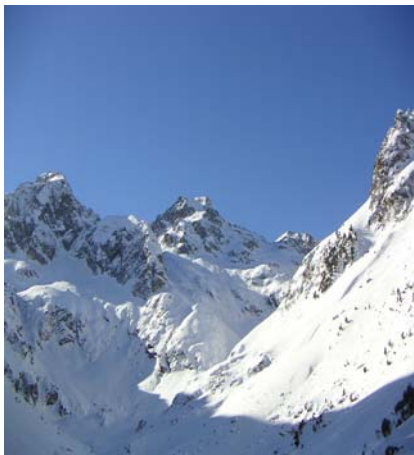
Pic de la Sede