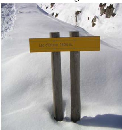
Panneau du lac