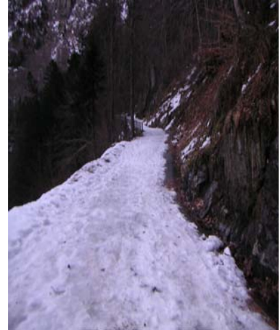
Départ de la route