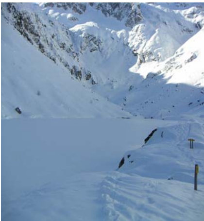
Lac d'Estom gelé