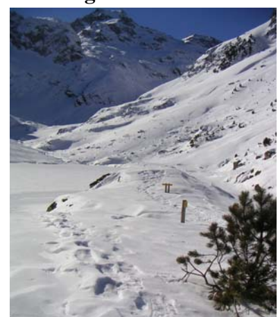
Rive gauche du lac