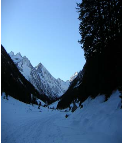
Vallée du Lutour