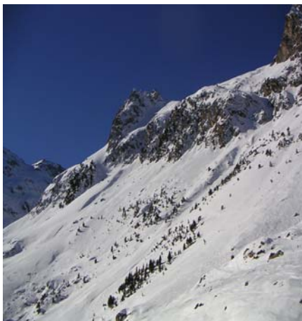
Sommets ouest du lac