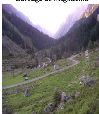
Au fond la Peyre Saint Martin