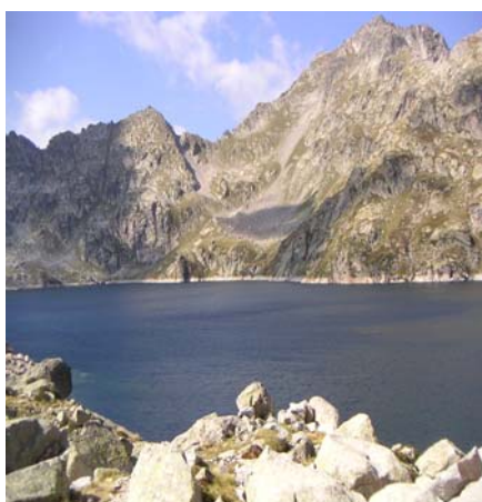
Lac de Migouélou