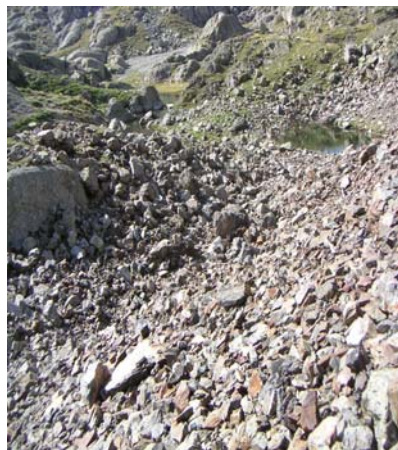
Laquets de Migouoélou