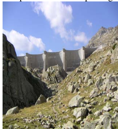
Barrage de Migouélou