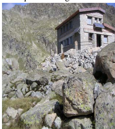
Refuge de Migouélou