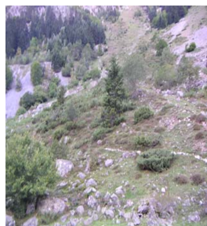
Départ du sentier au parking