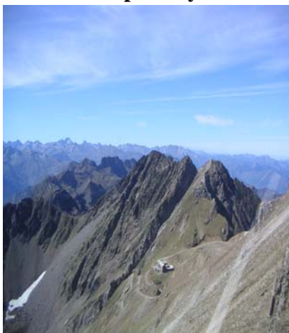
La chaîne des Pyrénées