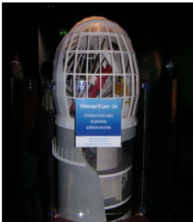
Télescope B Lyot