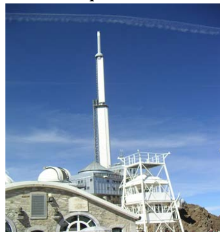
Le sommet du pic