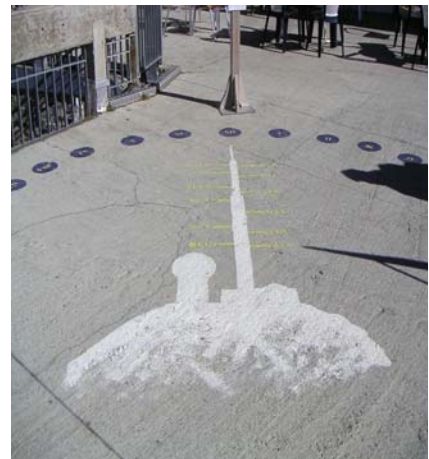
Marquage au sol