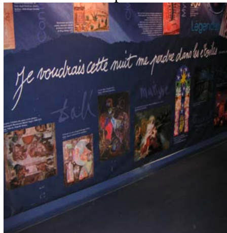
C'est vrai que ce serait beau