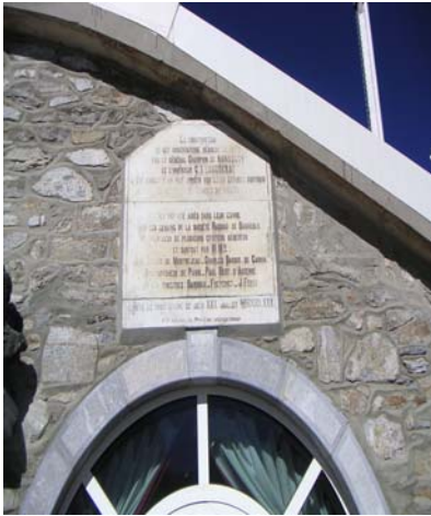
Entrée niveau 4