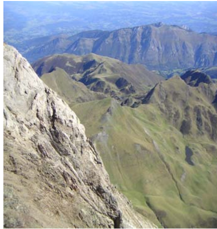
Vue sur la plaine