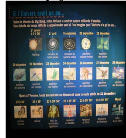
L'univers en un an