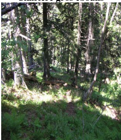
Sapins sentier Falisse