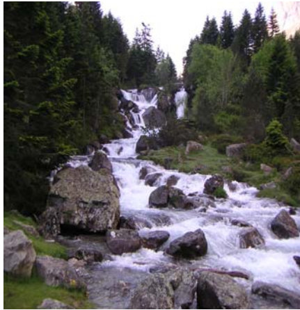
Cascade Pourtau du Limouras