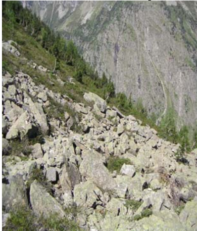
Clairière gros éboulis