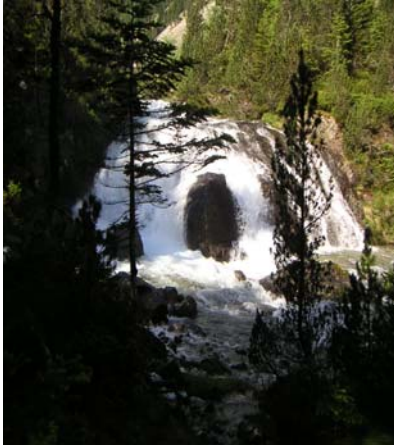
Cascade cabane Pouey Caut