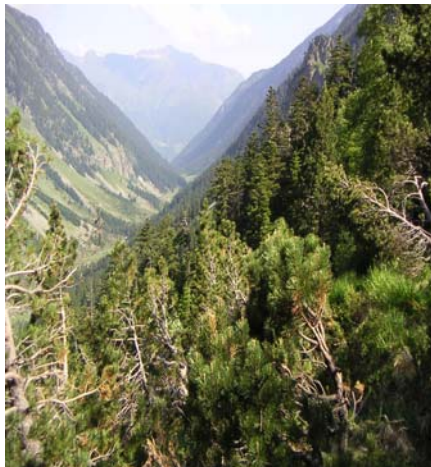
Vallée du Lutour