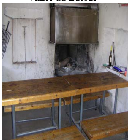
Salle à manger du refuge