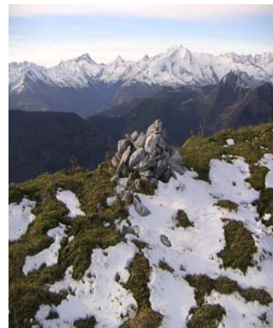
Cairn au soum d'Andorre