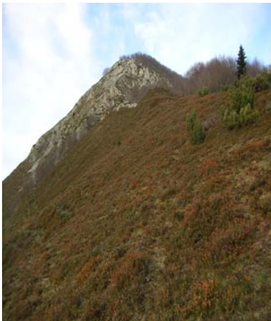
Montée vers le Soum d'Andorre