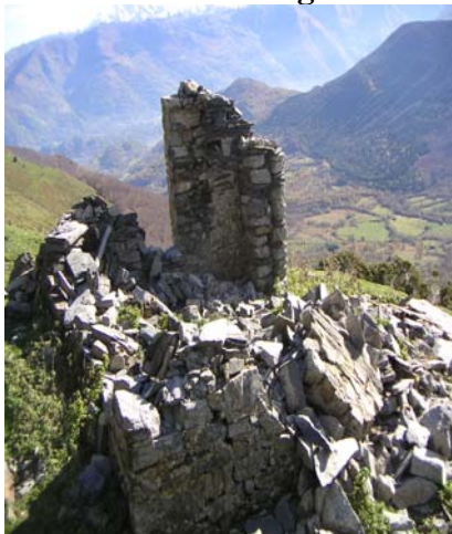
Cabane en ruine