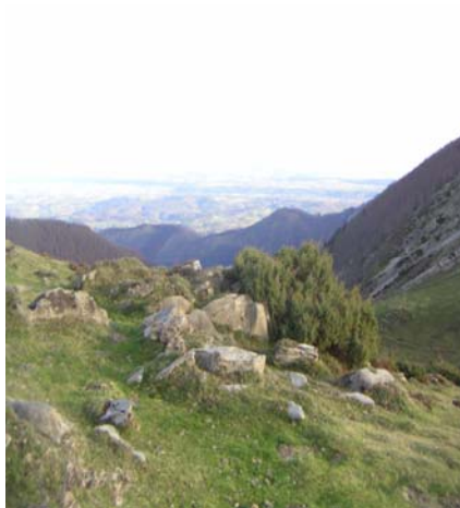
Plaine vue du col d'Andorre