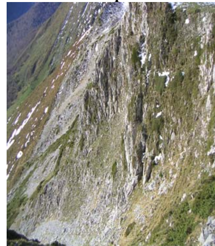
Escarpements près de Conques