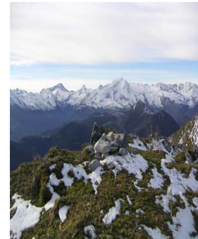
Cairn au soum de Conques