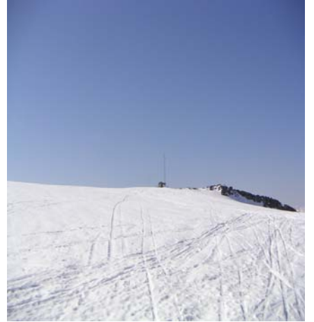
La carotte de l'altisurface