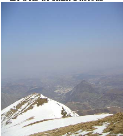
Lourdes depuis le Trézères