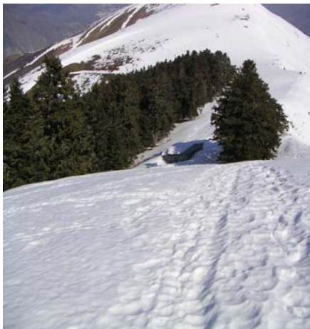
Le bois de saint Pastous