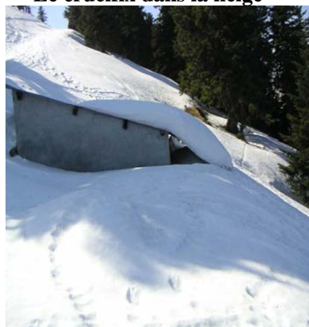
Toit de neige en glissade