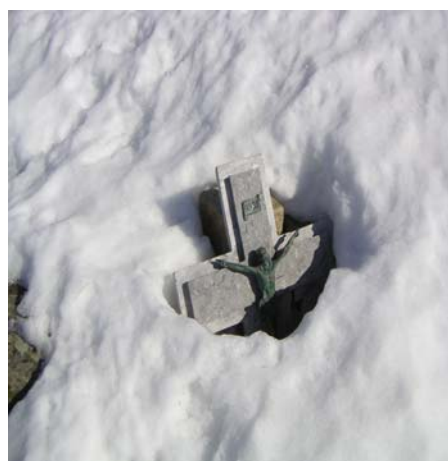
Le crucifix dans la neige