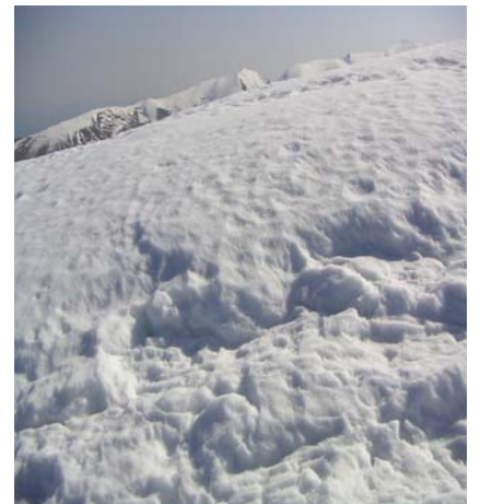
Que de neige au sommet