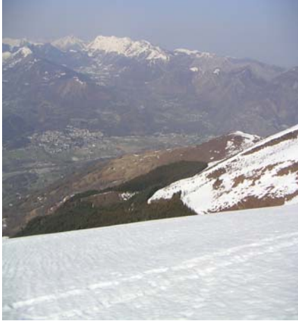
La crête du col d'Andorre