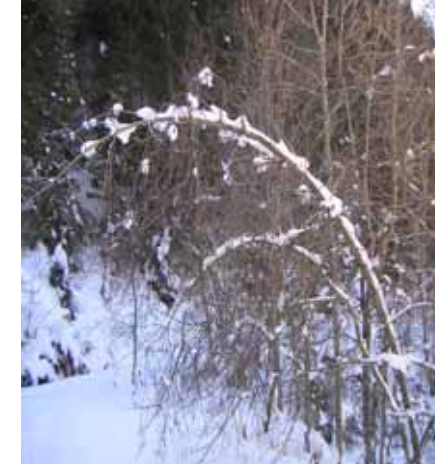
Arc de triomphe de neige