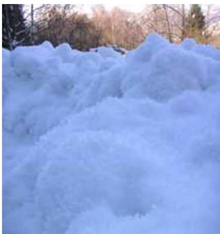
Neige ventilée et gelée