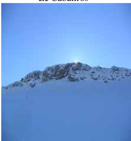
Soleil naissant à l'Altisurface