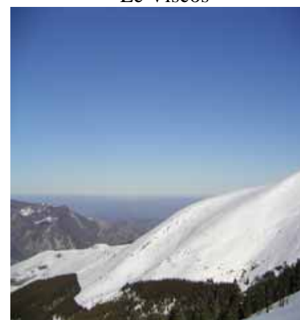
Au loin : la plaine