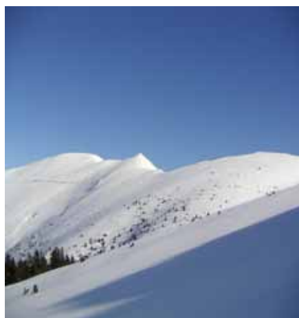
Le soum du Hautacam