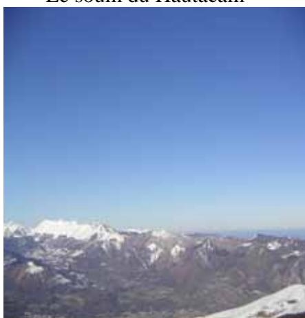
Chaîne du Pibeste