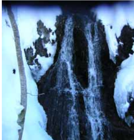
Cascade sous la neige