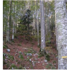
Balisage à suivre