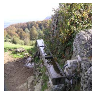
Abreuvoir de l'Aoulhet