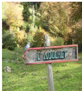
Panneau et son oiseau