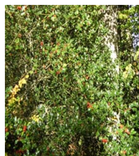
Houx tout rouge