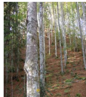
Rayons de soleil en sous-bois