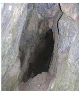
Grotte au bord du sentier