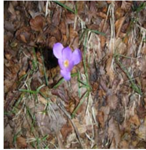
Colchique au soleil