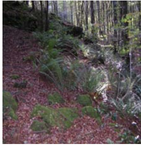
Fougères en sous-bois