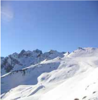
Domaine skiable du Bédéret