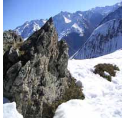
Vue sur le Maraout