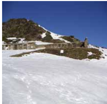
Hôtel en ruine au col de Riou