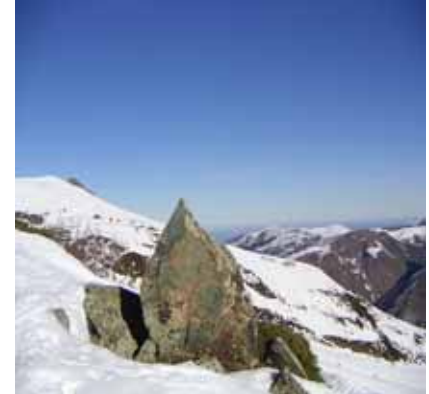
Vue sur la plaine