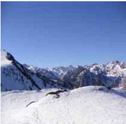
Vue sur montagnes de Cauterets