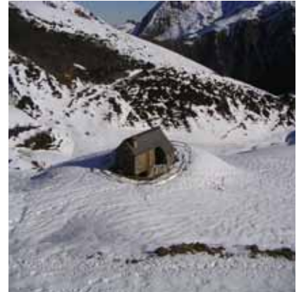
Cabane de Counques