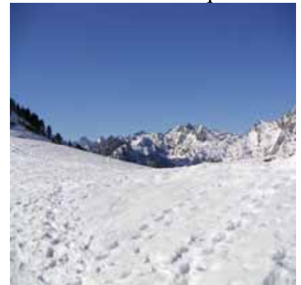
Col de Riou