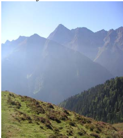
Au loin le Pic du Midi