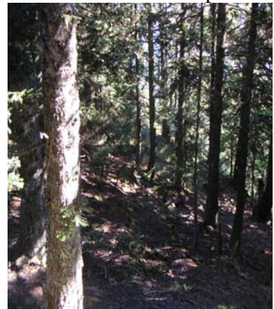
Passage en forêt de sapins