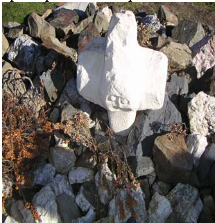
La croix de Béliou