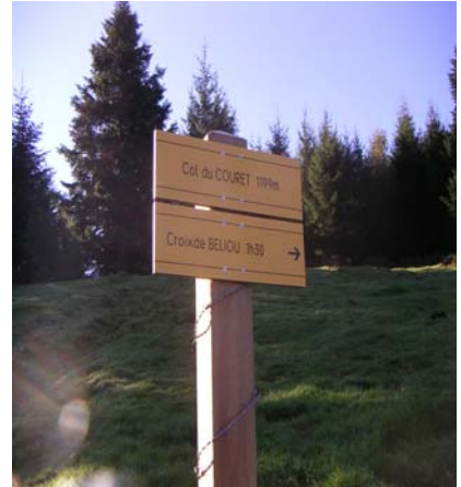
Panneaux de départ