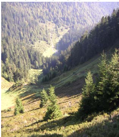
Le cortail de la Glère