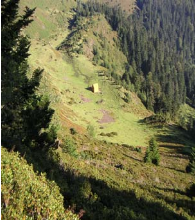
Cabane jaune sous le sentier