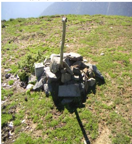
La borne à La Peyre