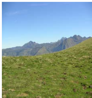
Au fond le Montaigu