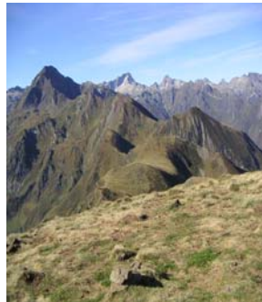
Au fond le Balaitous