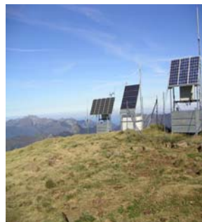
Installations au sommet