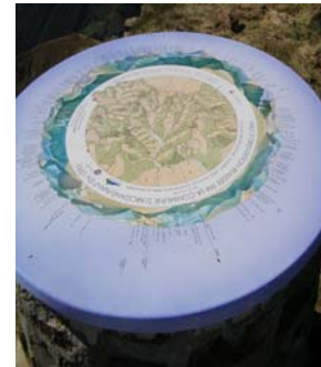
Table orientation sommet