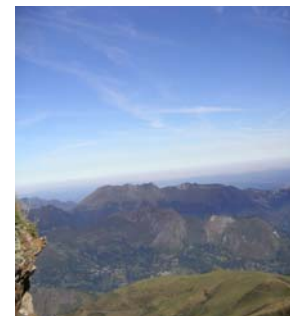
Vers le val d'Azun