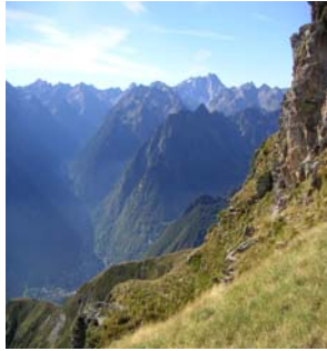
Au fond le Vignemale