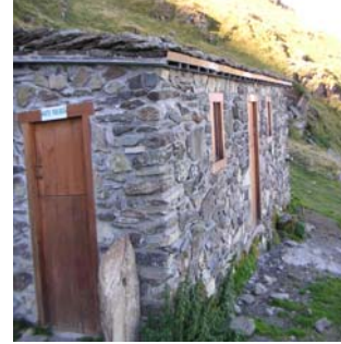
Cabane de bergers