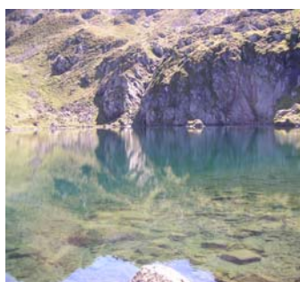
Le lac de Bassias