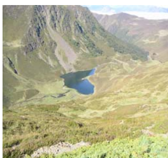
Le lac d'Isaby