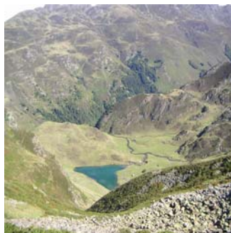
Le lac d'Ourec