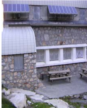
Refuge de Larribet