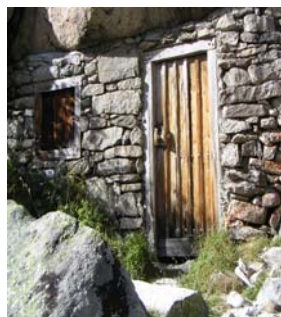
Toue de Larribet