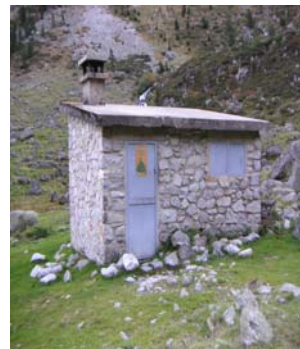
Cabane de Doumbas