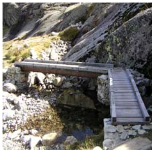
Ponts d'accès à Larribet