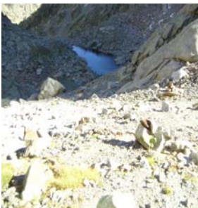
Lac inférieur de Micoulaou