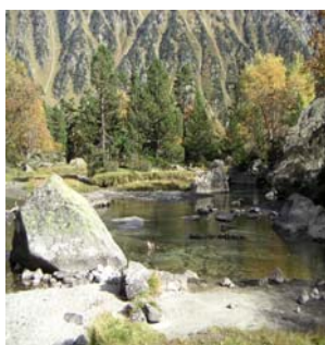
Jardin japonais à la Claou