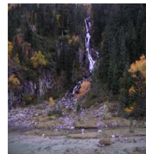
Cascade du Doumbas