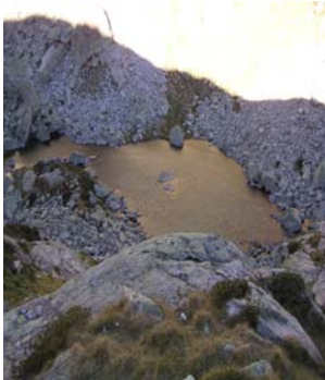
Lac inférieur Baterabère