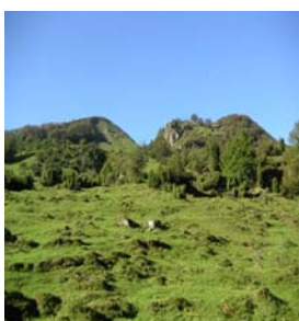
Plateau sortie forêt