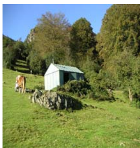
La cabane des aoulhets