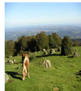
Vue sur la plaine