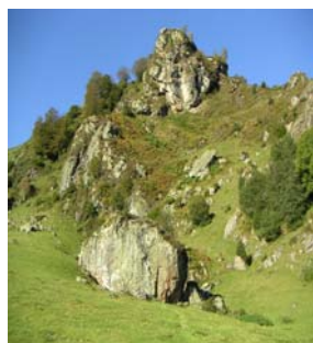
Rochers à droite de Larbaste