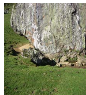
Abreuvoir sous roche