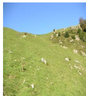
Col de Larbaste