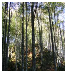
Hêtraie au matin