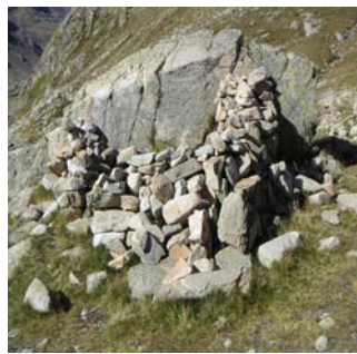
Abri de fortune au port