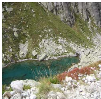
l'harmonie des couleurs