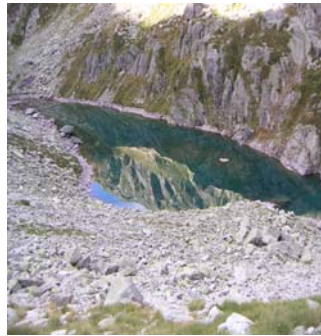
Lac de Rémoulis amont