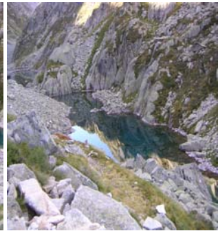
Lac de Rémoulis aval