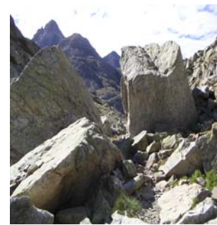
Arrivée au port