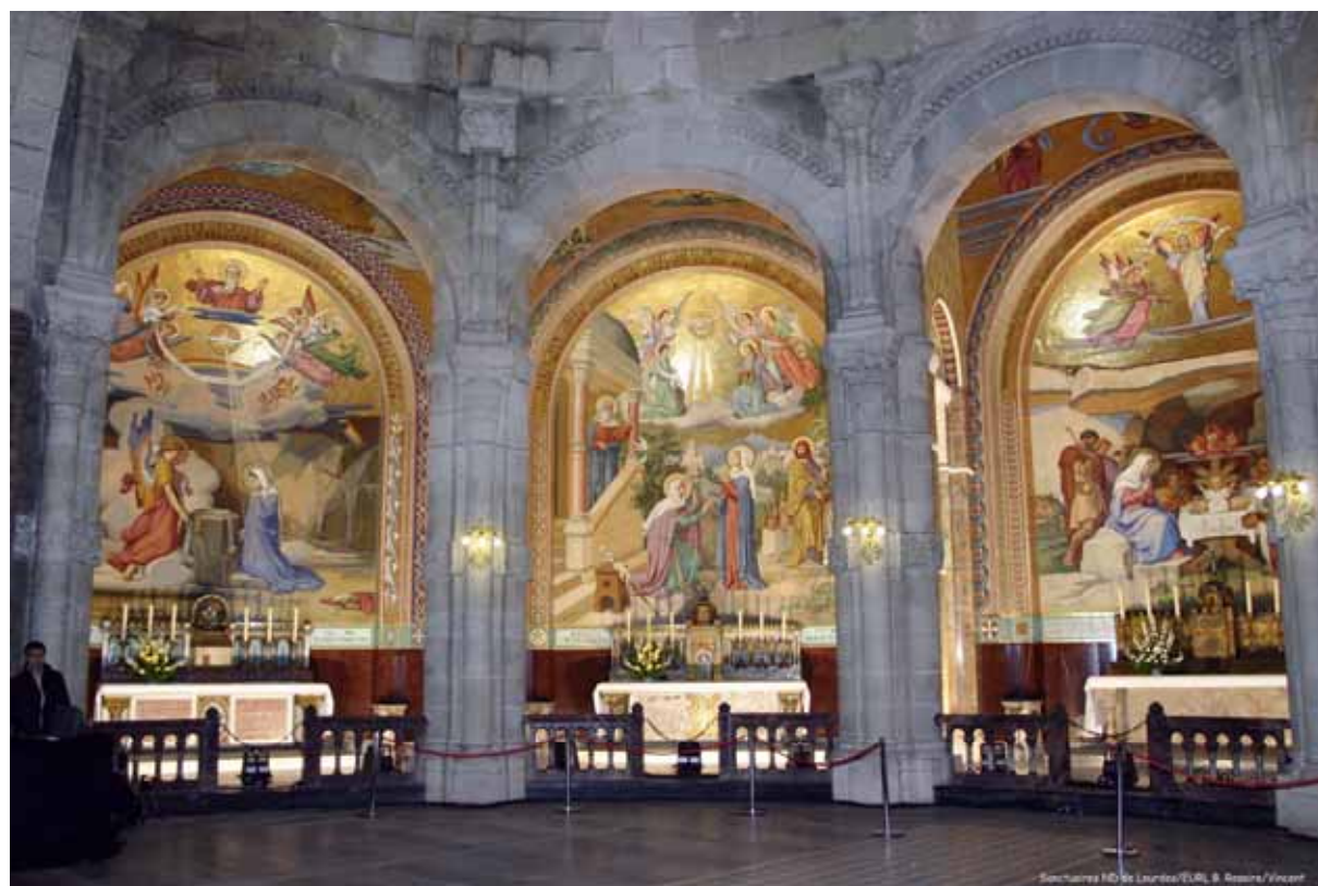
Trois des quinze chapelles restaurées

Les initiés, et ils sont nombreux ici, savent que le séchage de telles structures confinées se limite à 5 à 10 cm par an. L'épaisseur des coupoles est d'environ 50 cm, aussi nous avons prévu dès la contractualisation entre la SEM et l'Association Diocésaine que la restauration des mosaïques de la coupole et des chapelles extérieures ferait l'objet d'une deuxième tranche. Récemment, nous avons réalisé un diagnostic sur ces ouvrages qui nous permet l'évolution, si les conditions techniques se confirment, d'envisager la fin de leur restauration pour avril 2006. C'est, Messieurs les institutionnels, le dernier dossier où nous aurons besoin de votre précieux soutien pour clore la réhabilitation de ce bel édifice.